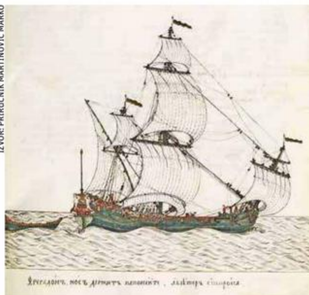
Crtež broda iz klase fregadona, trgovačkih brodova kakav je bio i potonuli brod kod Hvara