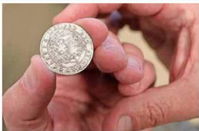
Srebrni novac austrijskog je podrijetla