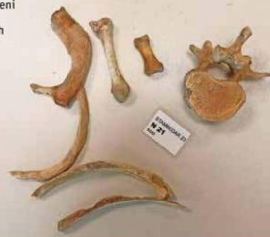
Pronađeni djelići ljudskih kostiju

lom, to pouzdano ne znamo. Imamo neke indicije da se to radilo, ali što je i koliko toga ilegalno odneseno s tog lokaliteta, to ne znamo – ponavlja Igor Mihajlović.