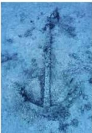
Sidro fregadona u dubini