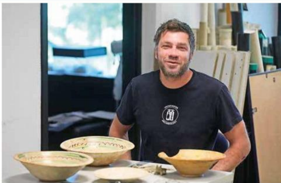
Igor Mihajlović: Jedan od najvećih izazova je identifikacija osoba koje su potonule zajedno sa brodom

Od keramičkih posuda istraživači izdvajaju tri engobirane zdjele, jedan sgraffito tanjur te dva karakteristična tanjura s crtežom krune na rubu koja pripadaju grupi