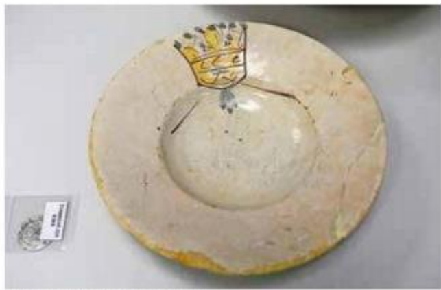
Pijlat s crtežom krune na rubu

koje su podvodni arheolozi skidali s pronađenih predmeta iz utrobe i oko broda, skidao sloj po sloj nepoznanica.